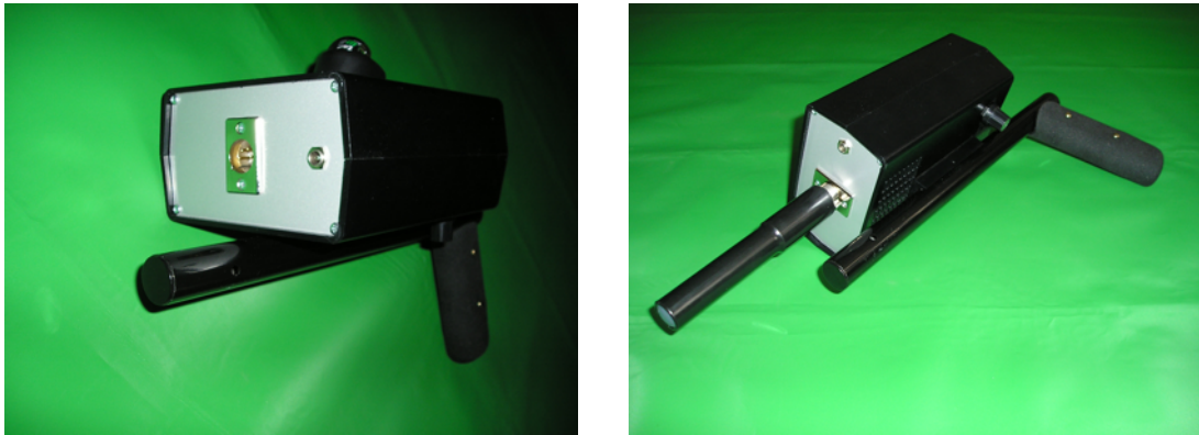
Abbildung 2: Montage und Anschluss der Sonde

In diesem Abschnitt wird gezeigt, wie Sie Ihr Gerät zusammensetzen und für die Messung vorbereiten.