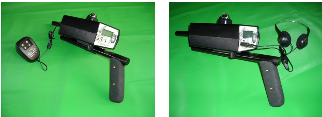
Abbildung 3: Anschluss von Ladegerät und Kopfhörer

In Abbildung 2 sehen Sie, wie die Sonde am Gerät angesteckt wird. Verzichten Sie dabei auf unnötige Kraftanwendung!