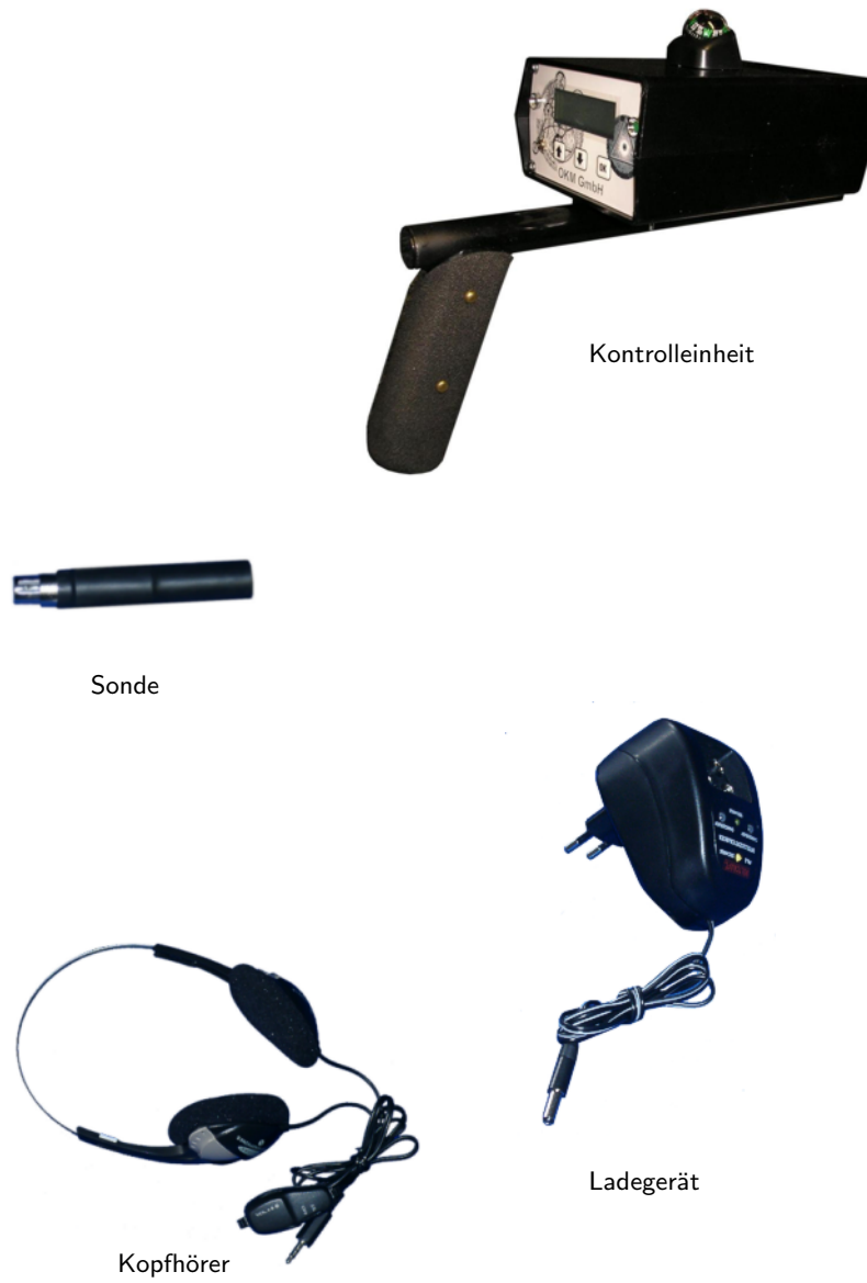
Abbildung 1: Lieferumfang