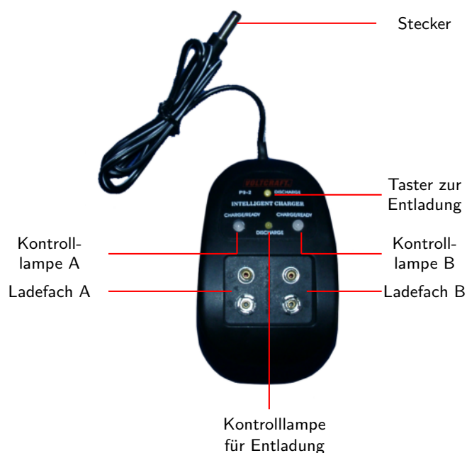
Abbildung 7: Vorderansicht Ladegerät

Die Abbildung 7 zeigt die Vorderseite des Ladegerätes und deren Funktionen.