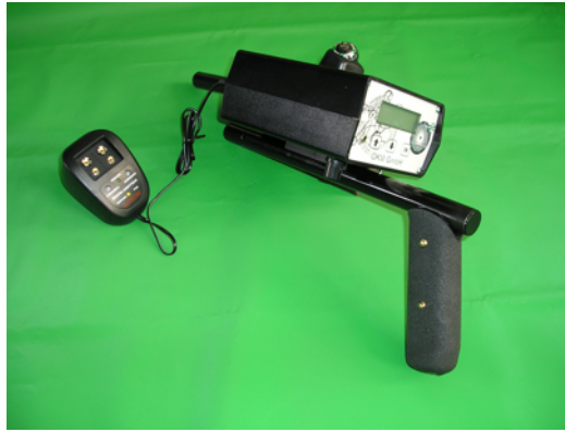
Abbildung 8: Anschluss des Ladegeräts

Zum Aufladen des Bionic alpha muss das mitgelieferte Ladegerät an die dafür vorgesehene Buchse angeschlossen werden, wie in Abbildung 8 dargestellt.